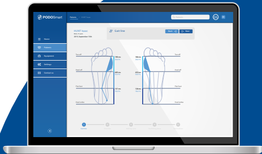
Online abrufbare KI-Software