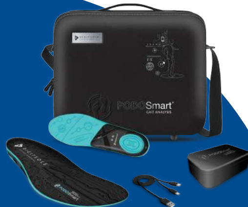
6 Paar Digitalsohlen + Bluetooth-Anschlussbox